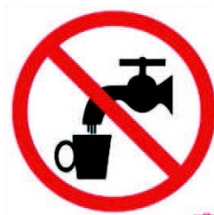
Ejemplo de pictograma

Ello puede hacerse mediante etiquetas o cualquier medio permanente con un texto y un icono, que así señalice que son elementos que contienen aguas pluviales y no de consumo, según las disposiciones vigentes.